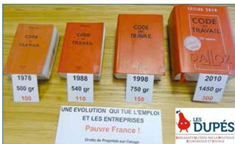
Photo du Code du travail dans ses versions successives qui témoigne de l'inflation normative (2013)