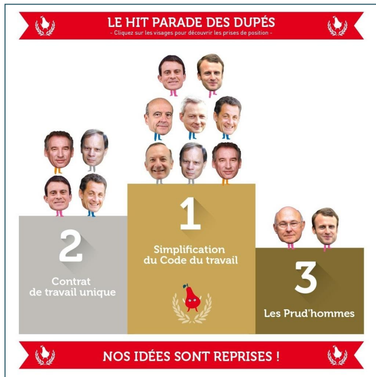
Hit-parade des hommes politiques les plus fidèles aux propositions des Dupés (2015)